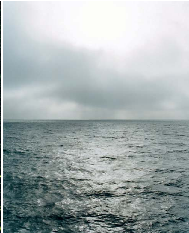
KATRIEN VERMEIRE/COURTESY CROWN GALLERY BRUSSEL