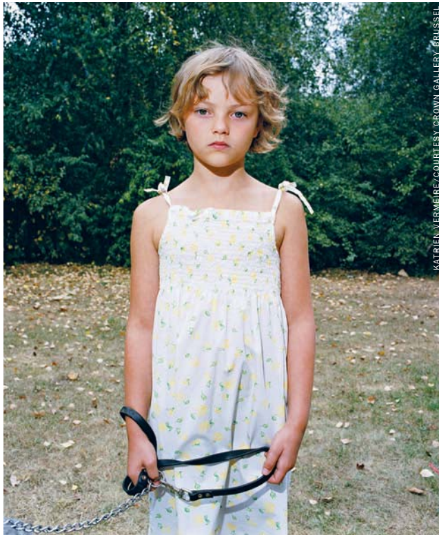
KATRIEN VERMEIRE/COURTESY CROWN GALLERY BRUSSEL